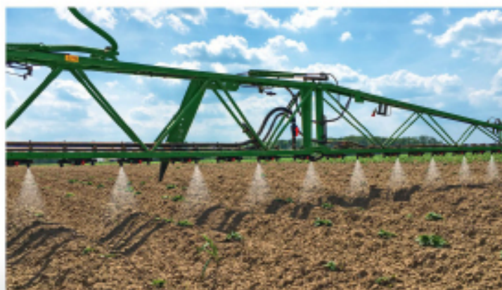
Pásový postřik v řádcích

AmaSelect Row od AMAZONE umožňuje u všech postřikovačů vybavených systémem AmaSelect změnit z kabiny celoplošný postřik na pásový postřik v řádcích. Tím je možné dosáhnout úspory přípravku až 65 %. AmaSelect Row si sám automaticky zvolí optimální trysky pro jednotlivé řádky. S přestavbovou sadou lze snížit rozteč trysek na 25 cm. Tak se snadno změní pásová aplikace u kultur s 50 nebo 75 cm roztečí. Využití systému je pak možné u různých kultur, jako kukuřice, brambory nebo i cukrovka s roztečí řádků 45 cm.