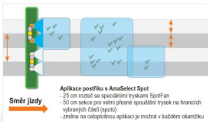
K obr.: vzdálenosti od plevelů k hranicím spotů jsou ve skutečnosti větší než uvedené rozteče v cm

Díky detailnímu snímku zaplevelení z dronu propojeného se Spot- aplikační kartou od AMAZONE je možné dosáhnout výrazné úspory pesticidů.